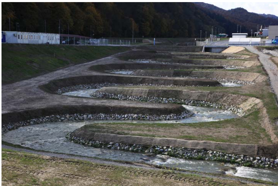
Po zaključeni izgradnji