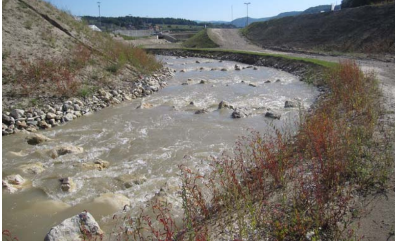
Prvi spust vode po sonaravnem delu

Trasa sonaravnega odseka vijuga ob jezovni zgradbi HE Blanca do iztočnega odseka na dolvodni strani. Celoten sonaravni odsek vsebuje 117 talnih pragov na medsebojnih razdaljah po 5 m in posameznim padcem v višini 10 cm.