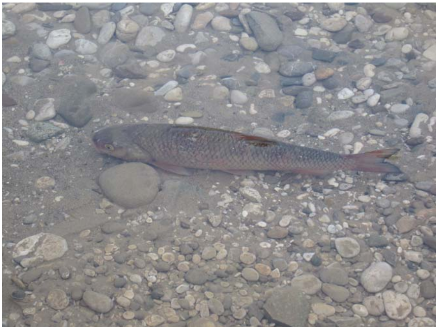
Prva riba v prehodu